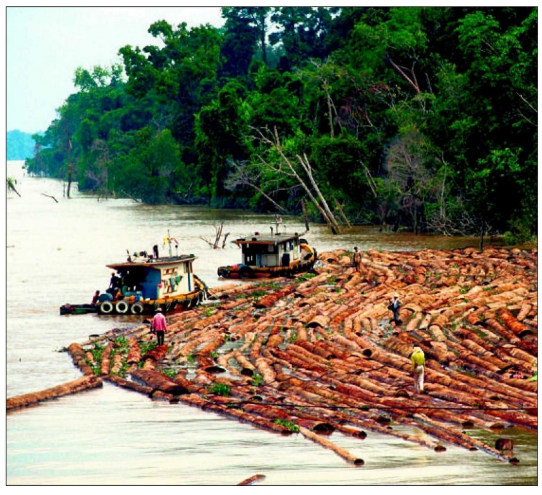
La préservation des forêts au Laos. Un projet soutenu par la Fondation 1796.

Un rapport de la Fondation 1796 montre à quel point le secteur de la philanthropie se révèle chaotique en dépit de ses intentions louables. MARC GUENIAT